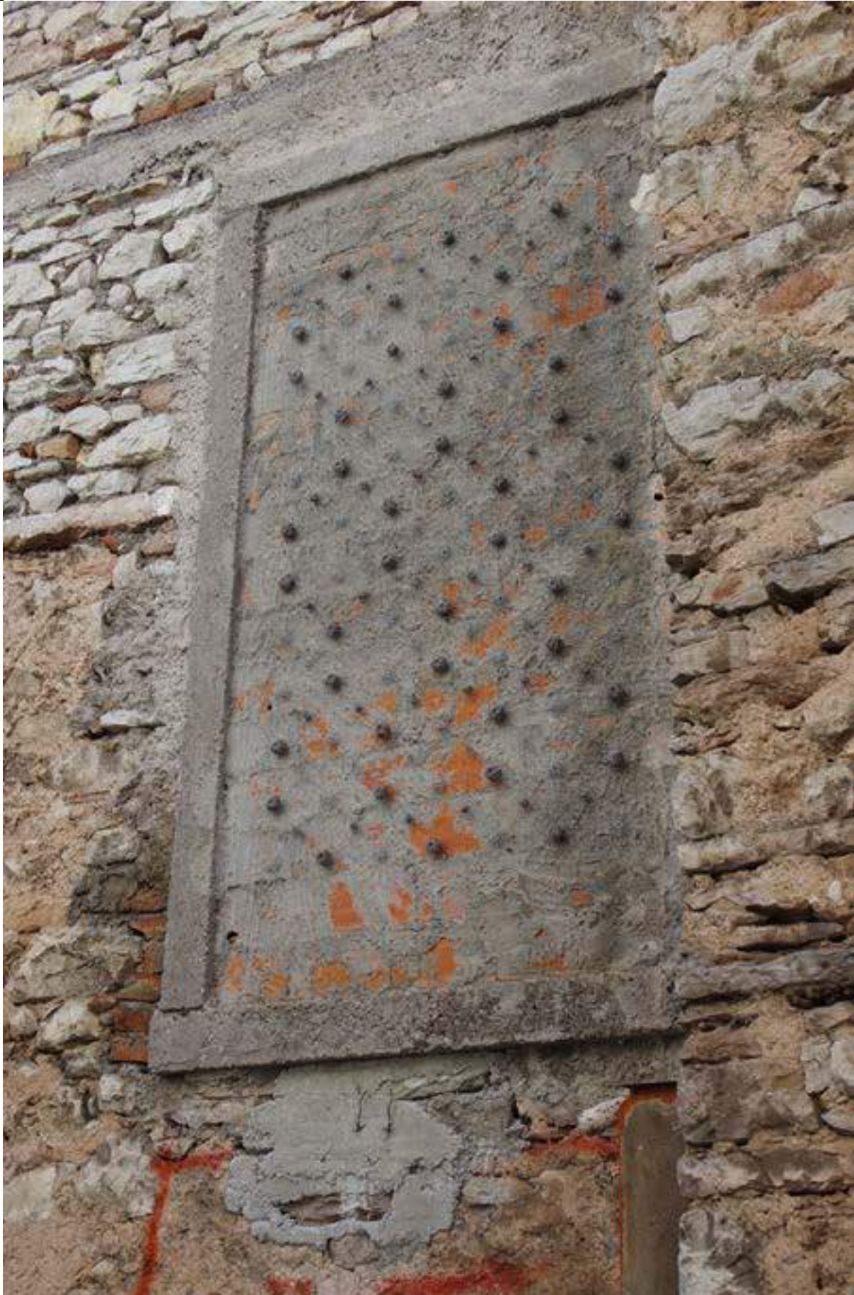
Fig. 11 "Giorno di festa", Installazione su muro di una vecchia casa del borgo, Casso, 2015.